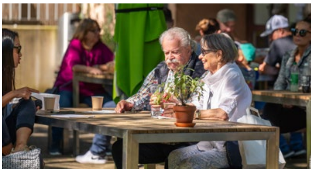
Bei schönstem Wetter gemütlich zusammensitzen und das bunte Treiben beobachten – auch das gehörte dazu.

Facebook-Link: facebook.com/stiftung.buehl.waedenswil Instagram-Link: instagram.com/stiftung_buehl