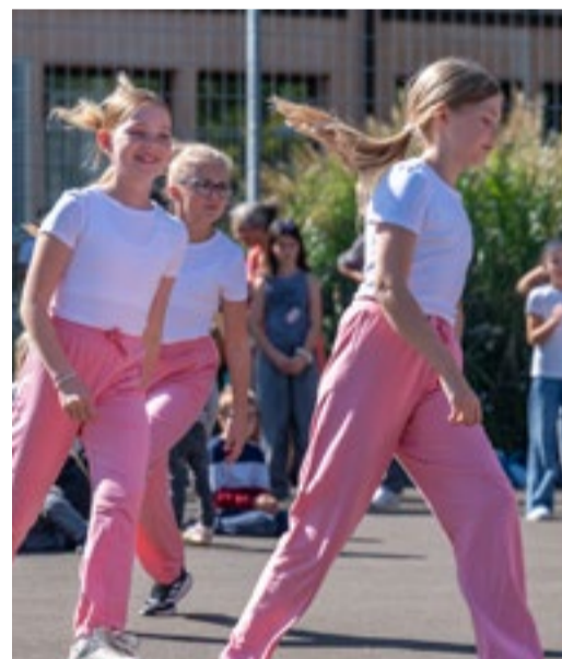
Die verschiedenen Shows begeisterten die Gäste.