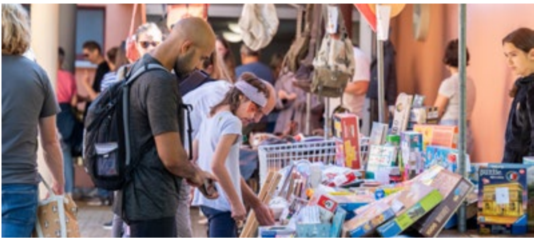
Am Flohmarkt konnte man viele Schätze entdecken.