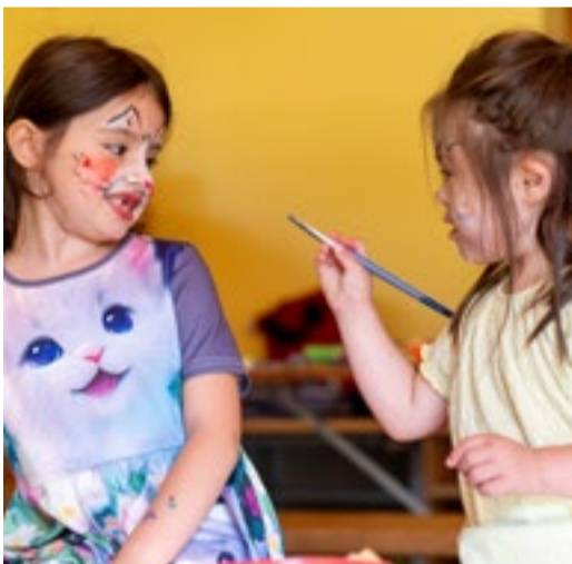
Viel Spass – auch untereinander – beim Schminken.

Viele Familien aus Wädenswil und den angrenzenden Gemeinden, Freunde, Mitarbeitende und ihre Familien, Partnerinnen, Kunden und ehemalige Kolleginnen und Kollegen haben bei strahlendem Sonnenschein mit uns gefeiert. Wir danken sehr herzlich für euer Kommen und die schöne gemeinsame Zeit.