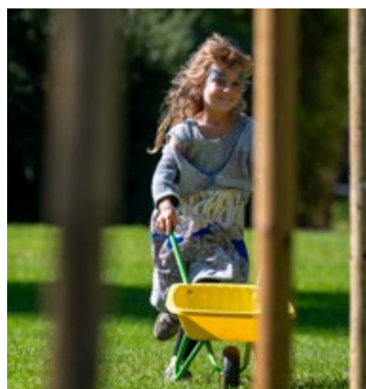
Beim Geschicklichkeits-Parcour gaben die jungen Teilnehmerinnen und Teilnehmer alles.